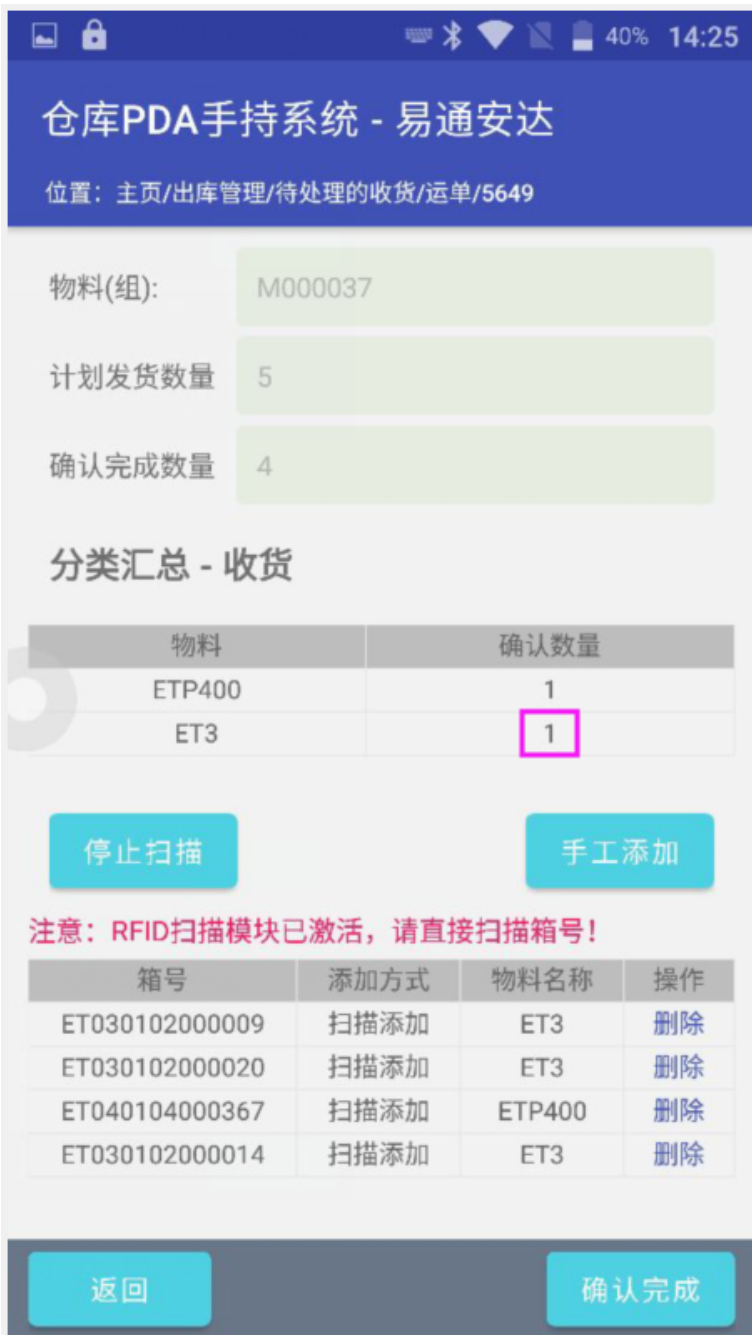
16. 扫描了箱号后保存回到退货列表页，然后再进入箱号列表页时，分录汇总中的表格被清空了